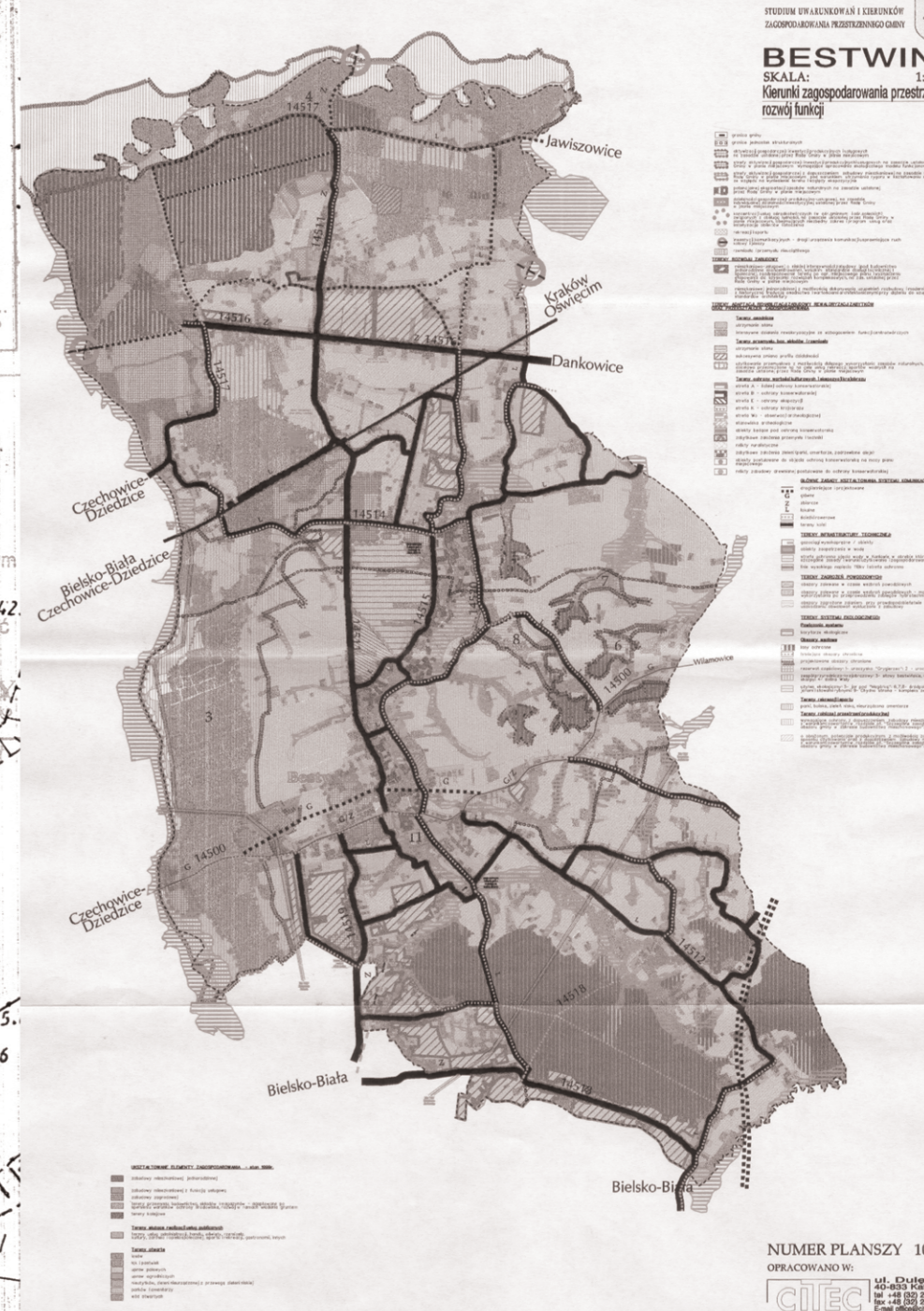
Wyrys ze Studium Uwarunkowań i Kierunków Zagospodarowania Przestrzennego Gminy Bestwina