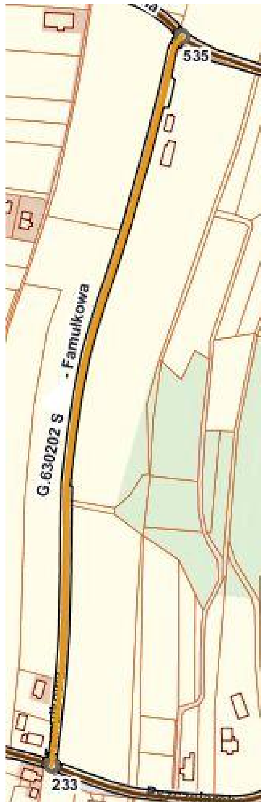
UL. FAMUŁKOWA - 630 202 S