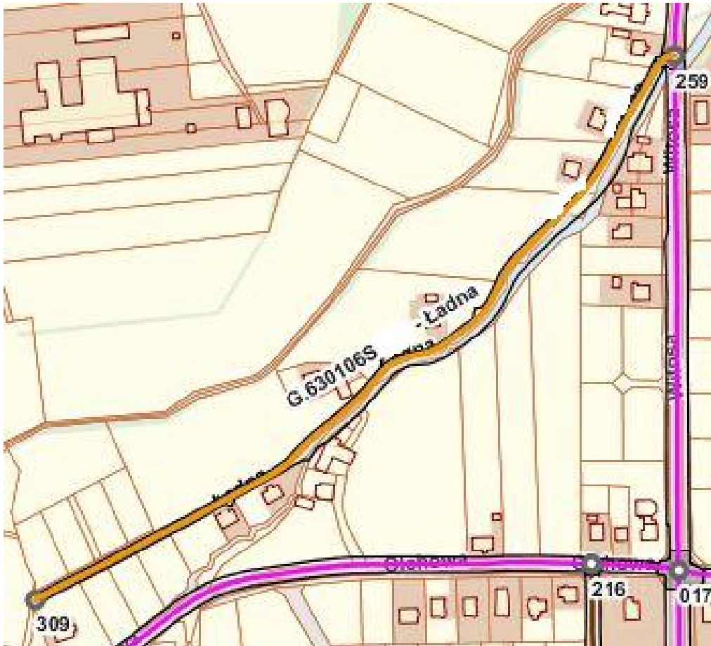
UL. ŁADNA - 630 106 S