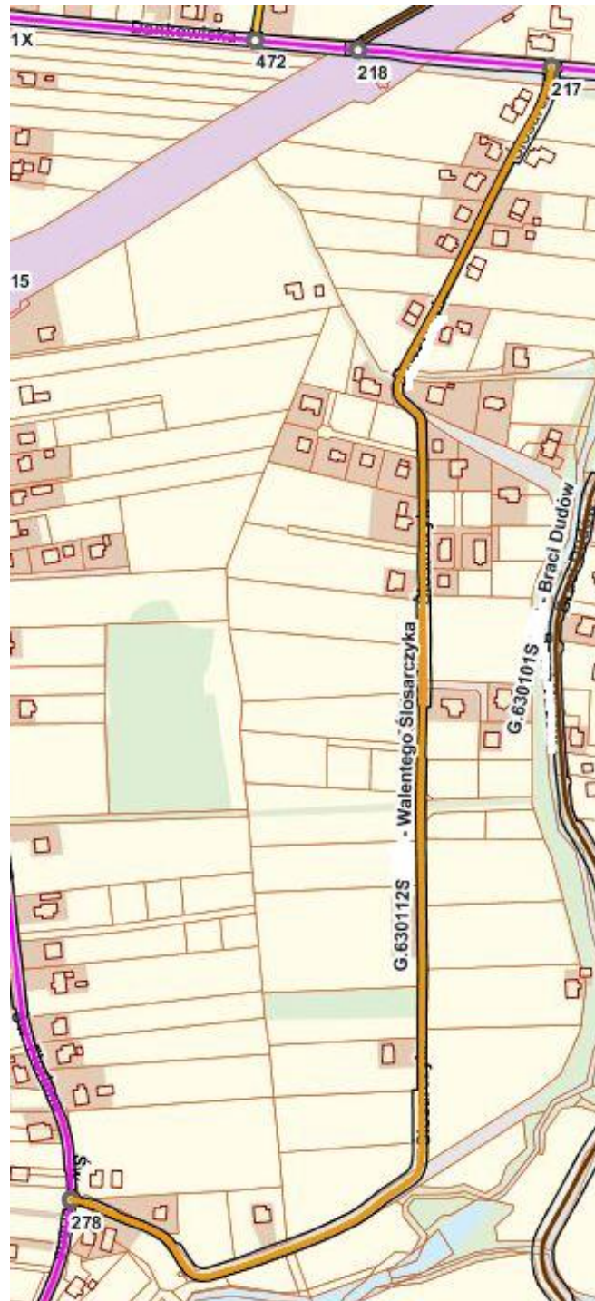
UL. WALENTEGO ŚLOSARCZYKA - 630 112 S