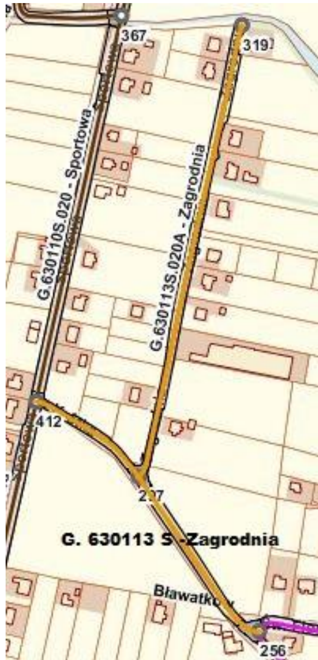
UL. ZAGRODIA - 630 113 S