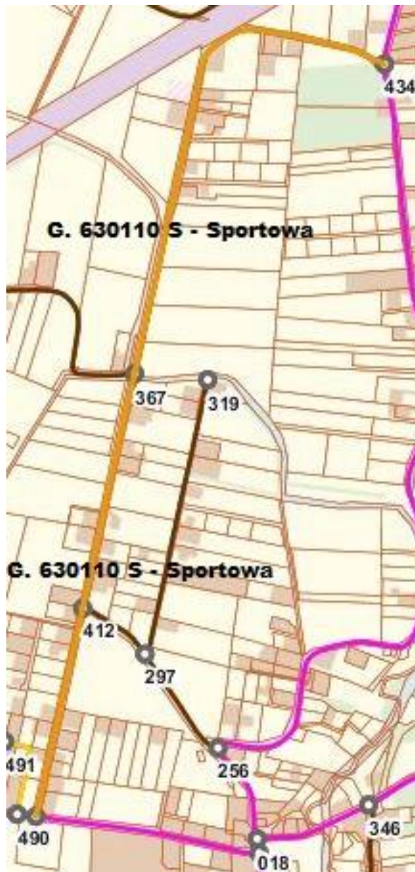
UL. SPORTOWA - 630 110 S